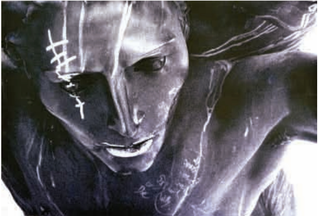
Bronze statue, Foro italico, Rome