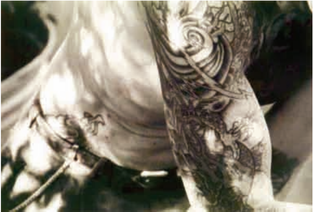
Olin, Truth-or-consequences, New Mexico