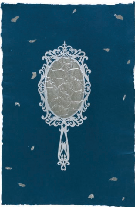
Огледалце, огледалце? I