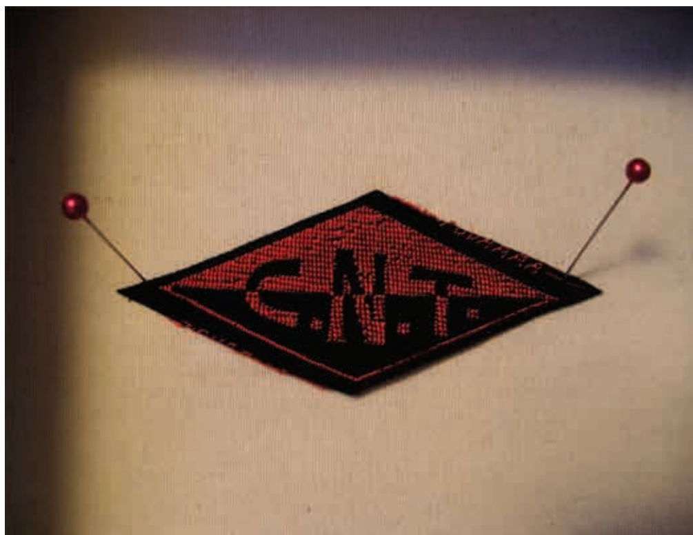
16. Kolekcija 3, 2008, digitalna štampa, 70 x 100 cm