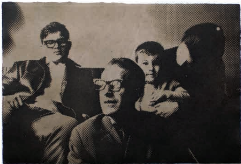
1. Familija, 2008. akvatinta, visoka štampa, 25 x 38 cm