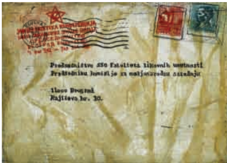
4. Prokletstvo 1979, 2008. akvatinta, bakropis, suva igla, 12 x 16 cm

Dobitnik je više domaćih i međunarodnih nagrada i priznanja za grafiku.