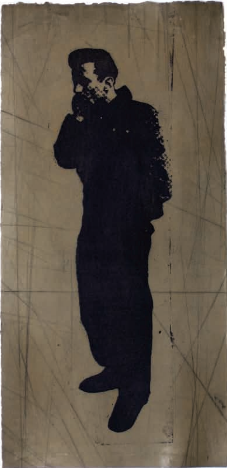
2. Isporuka, 2008. akvatinta, visoka štampa, 38 x 25 cm