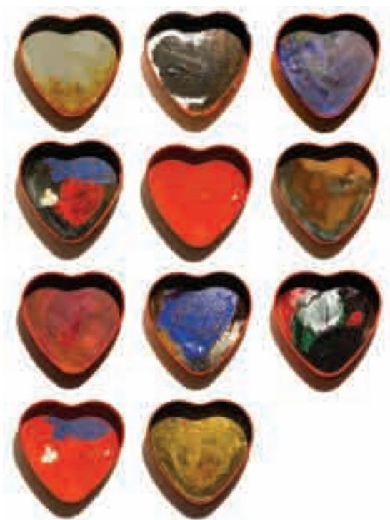
11. Oslikana ljubav, 2008, digitalna štampa, 120 x 80 cm

Reprodukcija na naslovnoj strani: F1 , 2008, digitalna štampa, 120 x 80 cm